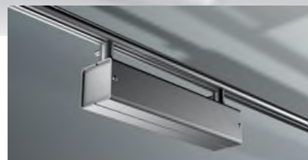
MOVE PICK-UP onder rail

voor 300 VA Chroom mat 71033 Goud mat 71035