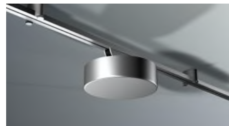
M-Line trafo / touchtrafo