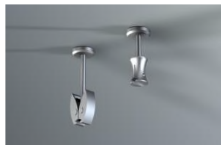
Plafondsteunen voor CLICKIN Links metaal, rechts kunststof