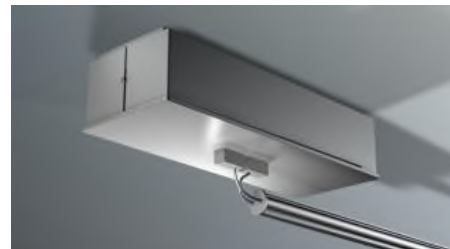
MOVE FREEUP 300 VA DC