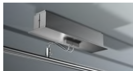
MOVE FREEUP 210 VA