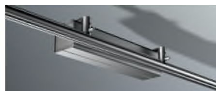
MOVE PICKUP aa de zijkant van de rail